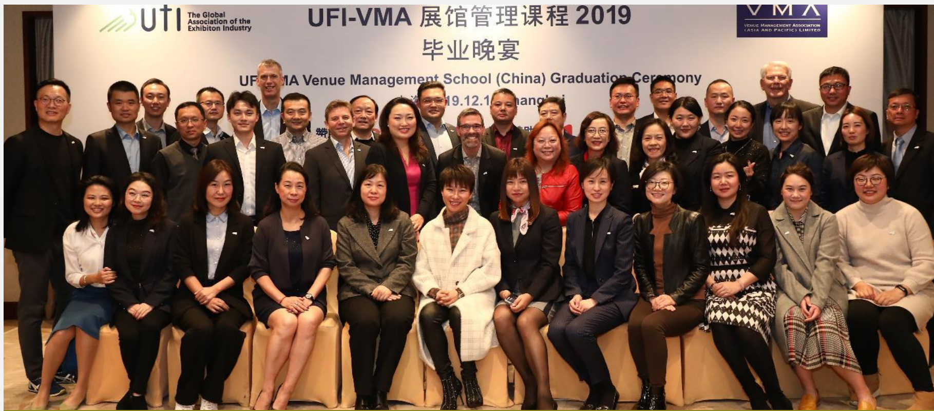
毕业晚宴合影照片