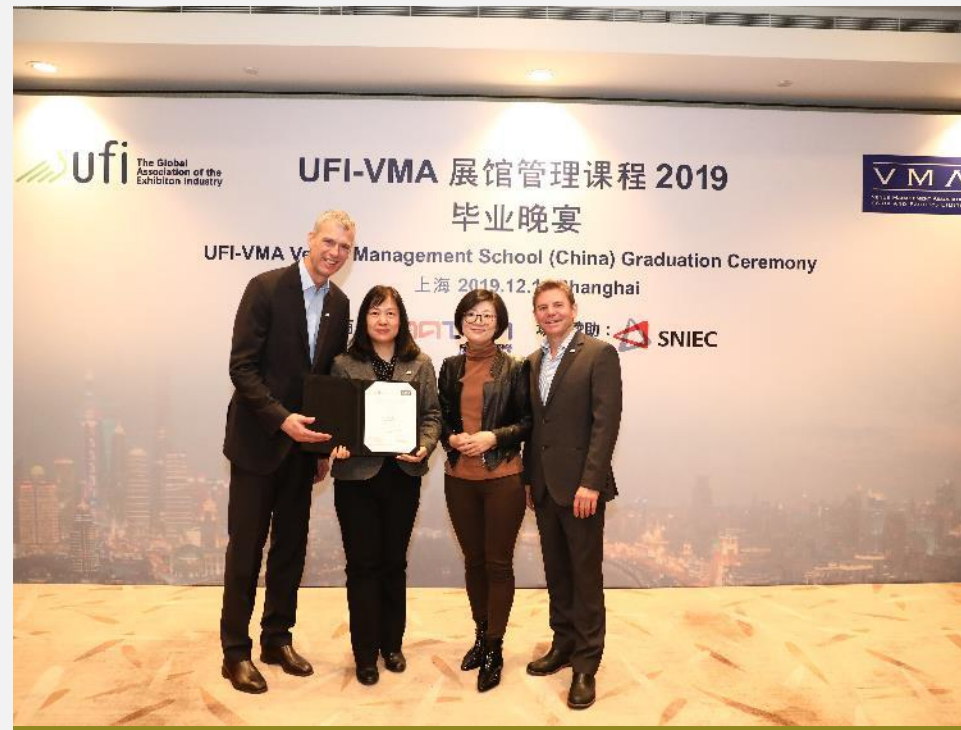
毕业证书颁发照片